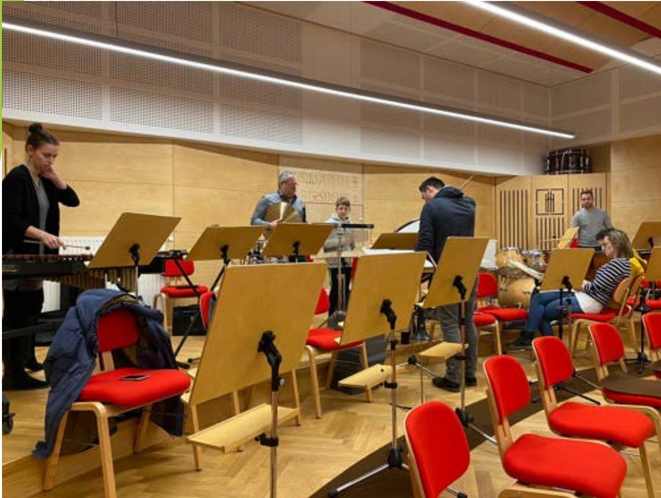
Besuch eines Schlagzeugworkshop