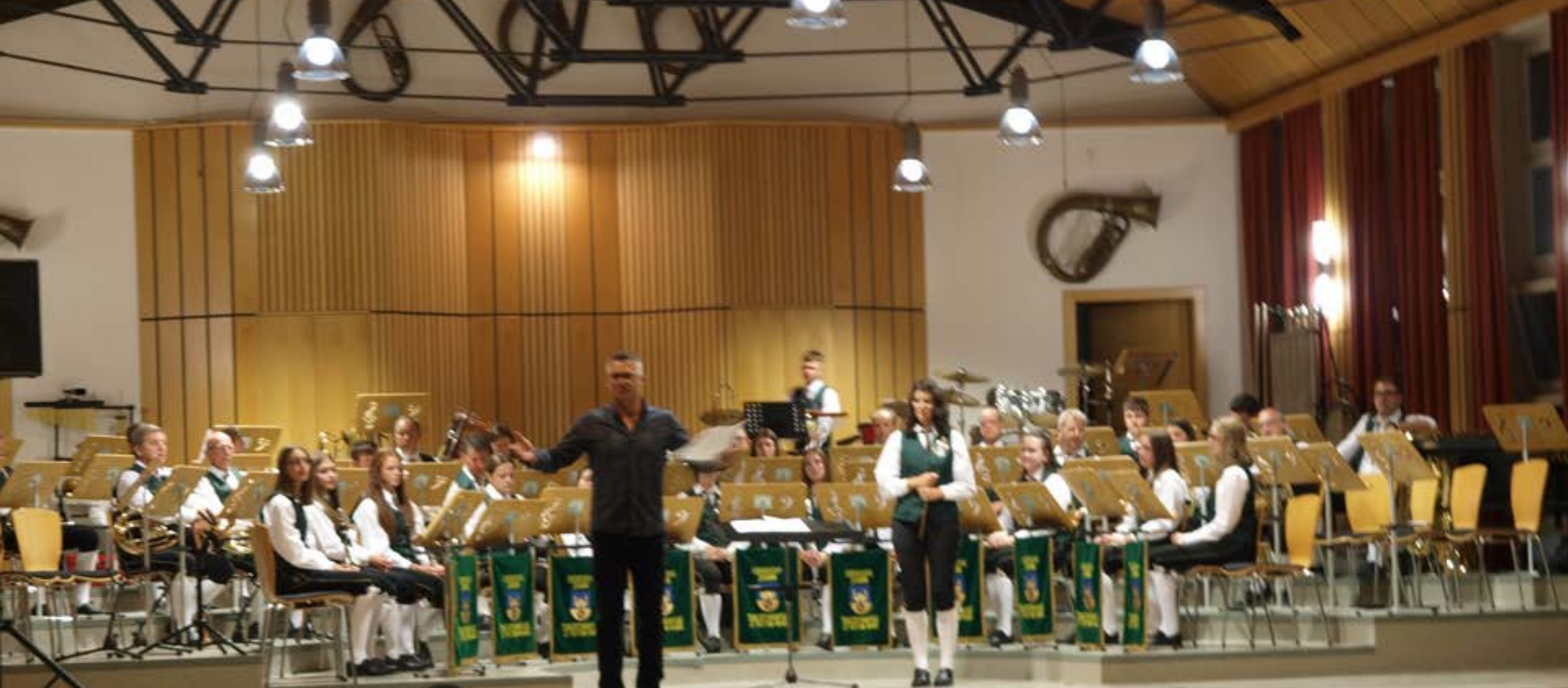
Abschlußkonzert 1. September 2021 Kultursaal St. Veit am Vogau