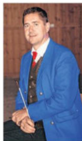
Kapellmeister Günther Reissegger

ße Herausforderung für Sie als Dirigenten dar?