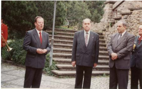
Einladung der Stadt Bregenz auf den Gebhardsberg