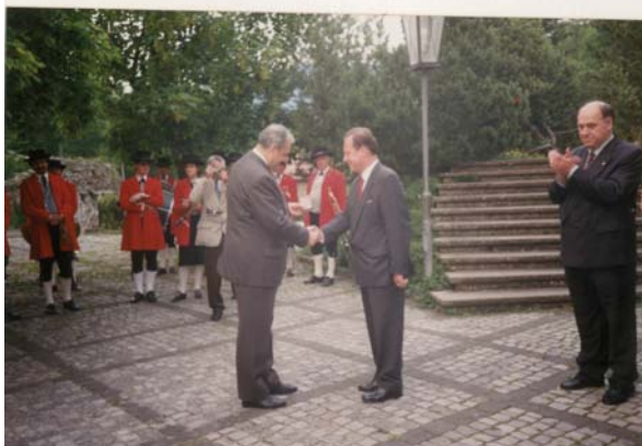
Die Musikkapelle Bregenz-Vockloster tritt zum Begrüßungs- ständchen an

Natürlich ist in diesem Rahmen keine auch nur annähernd vollständige Würdigung dieser für die Geschichte der Blasmusik und des Blasmusikverbandes sehr wertvollen Sammlung möglich. Einige Bilder sollen zumindest einen kleinen Einblick in diese interessanten Fotobände geben.