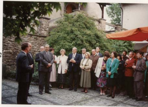
Bürgermeister Dipl.-Ing. Siegfried Gasser betont die Wichtigkeit der Blas- musik in allen Bereichen des öffentlichen Lebens