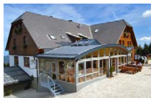
Alpengasthof Sabathy (1.620m)

Die Anreise zu allen angeführten Ausgangspunkten ist mit dem Auto möglich.