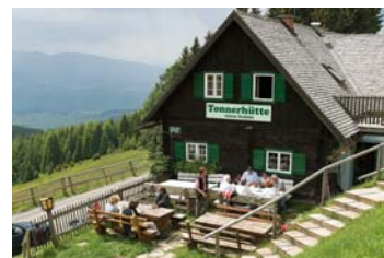
Tonnerhütte (1.650m)/ Herterhöhe

Anreise über Mühlen/Neumarkt oder Hüttenberg