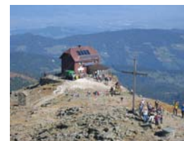
Zirbitzkogel Schutzhaus (2.396m)

Die Gehzeiten sind von allen Ausgangspunkten etwa gleich lang. Es kann mit ca. 2 bis 2 1/2 Std. bis zum Gipfel (Schutzhaus) und mit einem Abstieg von ca. 1 1/2 Std. gerechnet werden.